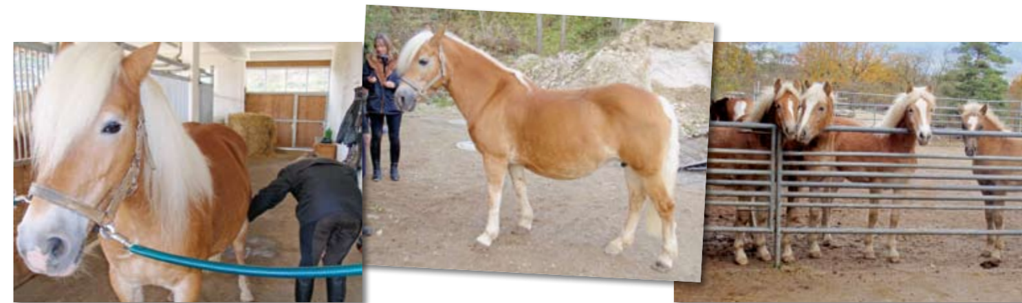
Novita lässt sich überall anfassen (links). Ihre Mutter Norena (Mitte) steht ebenfalls auf dem Gestüt. Der blonde Nachwuchs (links) von Novita und ihren Stallgenossinnen drängt sich am Zaun des weitläufigen Aktivstalls.

Umgänglicher als Novita kann man sich ein Pferd nicht wünschen. Sie lässt sich überall an-