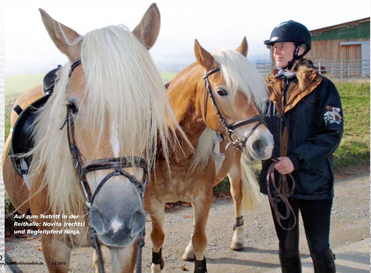
Auf zum Testritt in der Reithalle: Novita (rechts) und Begleitpferd Ninja.